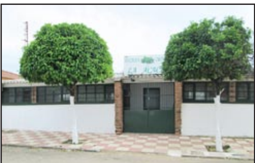
Ochavillo montará el Centro Guadalinfo en la antigua biblioteca y centro social de La Acacia.